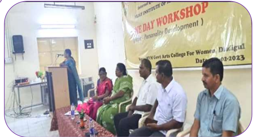
Dept of History