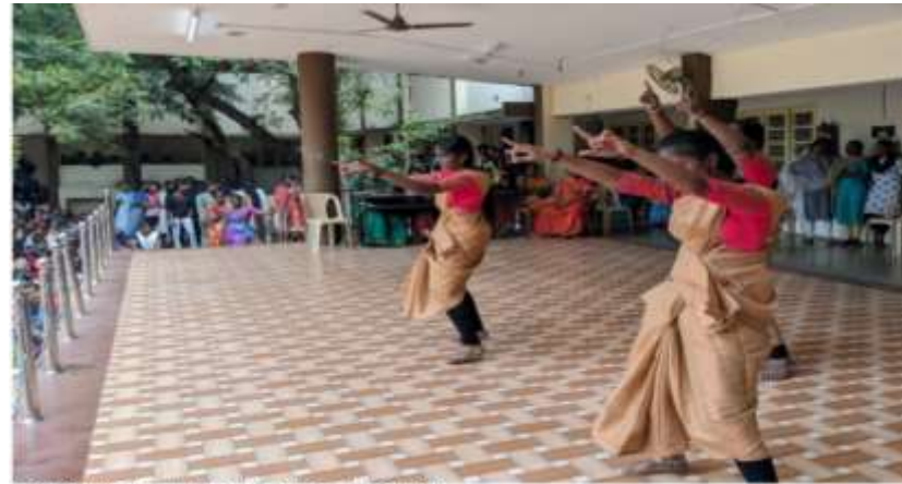
ON STAGE EVENTS- 31.01.2024