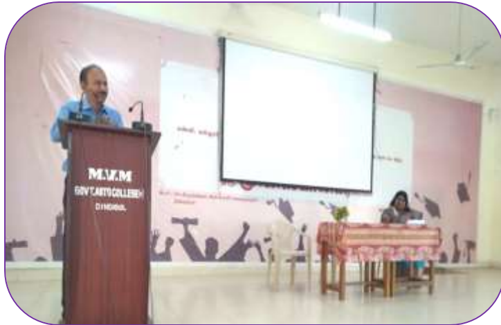
Dept of Botony