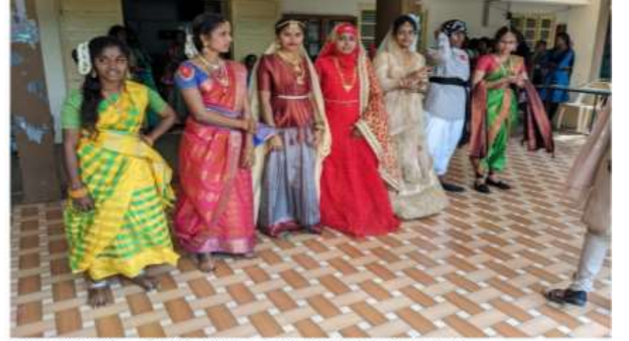
FINE ARTS – ON STAGE EVENTS 31.01.2024