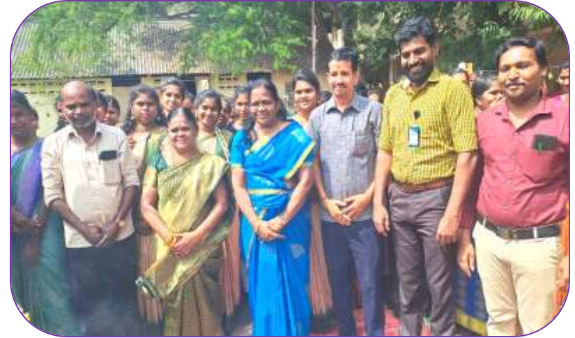
Department of History