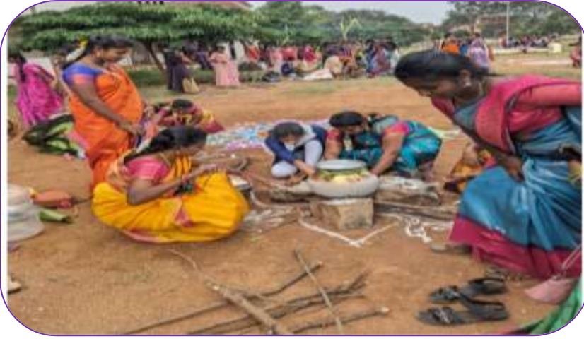
Department of Economics

12.01.2024 அன்று அனைத்து துறையைச் சார்ந்த ஆசிரியர்கள் மற்றும் மாணவிகள் தமிழர் திருநாளாம் தைப்பொங்கலை நமது கல்லூரியில் பொங்கல் வைத்து இனிப்புகள் வழங்கியும் ஆடல், பாடல், கும்மி, சிலம்பம் போன்ற நிகழ்ச்சிகள் நடத்தியும் கொண்டாடினார்கள்.