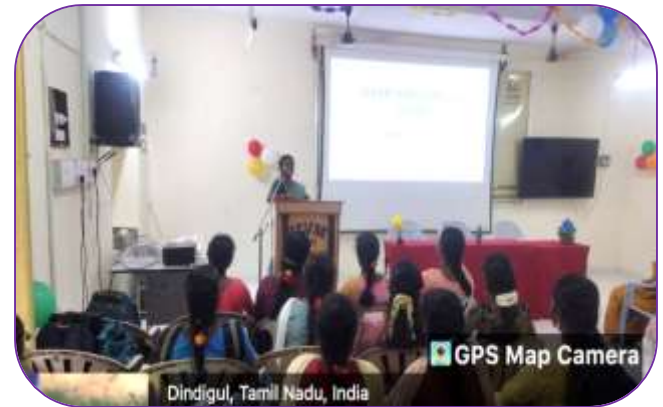
Dept of Computer Science