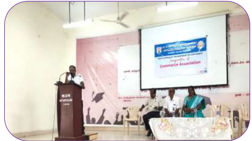
Dept of Commerce