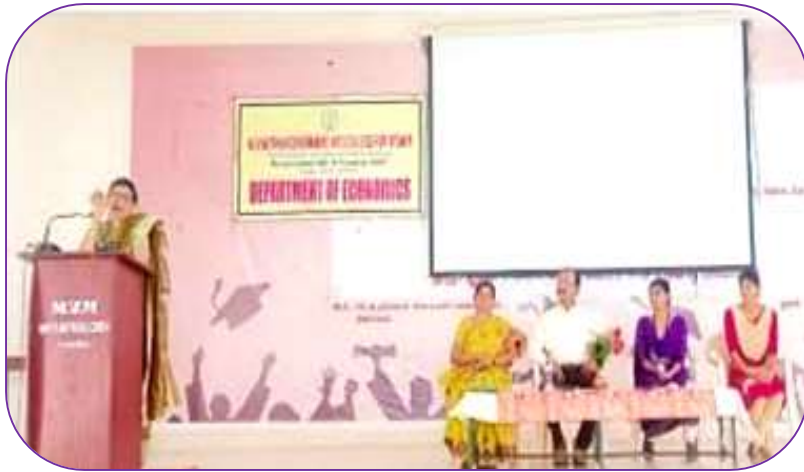
Dept of Economics