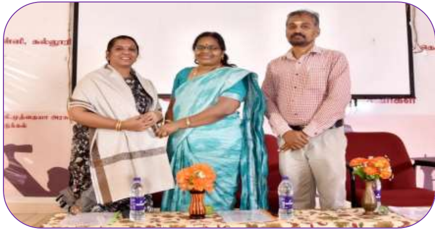
LIBRARY ASSOCIATION MEETING