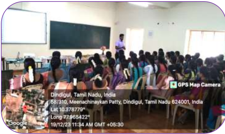
Dept of Chemistry