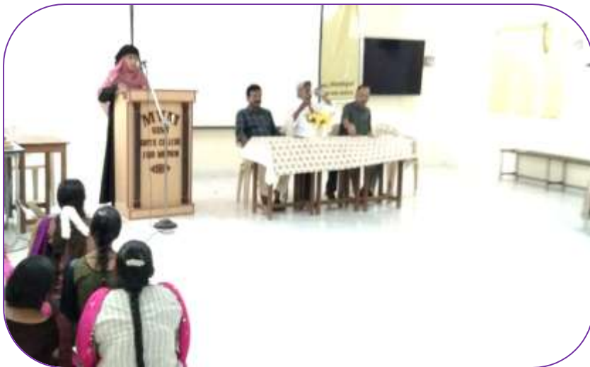
Dept of Maths