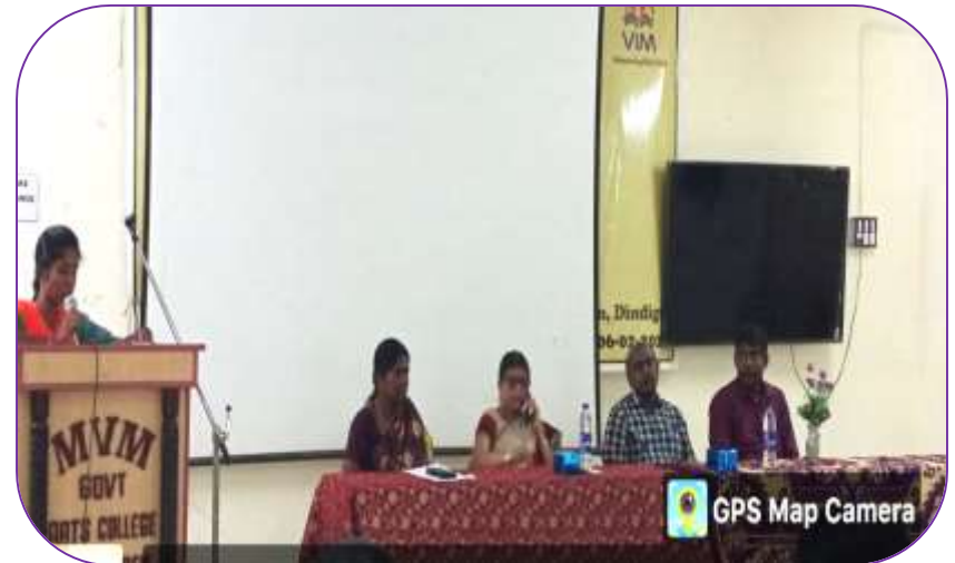
Dept of Physics