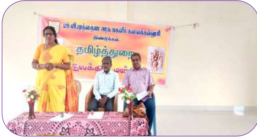
Dept of Tamil

கல்லூரியின் அனைத்து துறைகளிலும் நடத்தப்பட்ட மன்றக் கூட்டங்களில் அந்தந்த துறை சார்ந்த சான்றோர்கள் மூலம் மாணவியருக்கு பயனுள்ள வகையில் சிறப்புரைகள் வழங்கப்பட்டன..