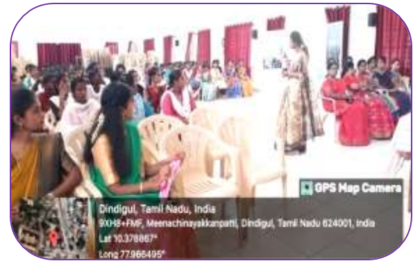
Dept of Zoology