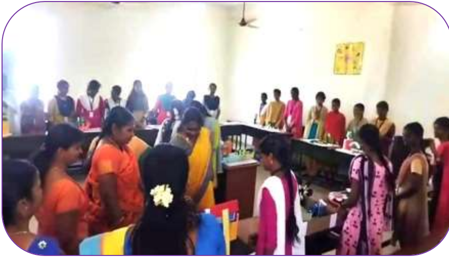
Dept of Computer Science

இயற்பியல் துறை சார்பாக 26.02.2024 மற்றும் 27.02.2024 ஆகிய இரண்டு தினங்கள் உலக அறிவியல் தினம் கொண்டாடப்பட்டது. பல்வேறு போட்டிகள் நடைபெற்றது. போட்டியில் வெற்றி பெற்ற மாணவிகளுக்கு பரிசு வழங்கப்பட்டது.