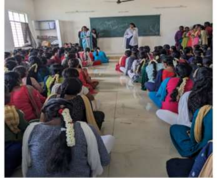
TEACHERS DAY CELEBRATION – SWEET DISTRIBUTION (05.09.2023) TEACHERS DAY CELEBRATION – 05.09.2023