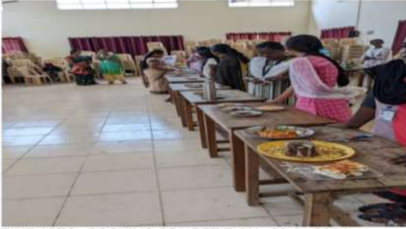
FINE ARTS - COOKING COMPETITION - 23.01.2024

18.03.2024 அன்று நமது கல்லூரியில் கவின் கலை விழா சிறப்பாக நடைபெற்றது.