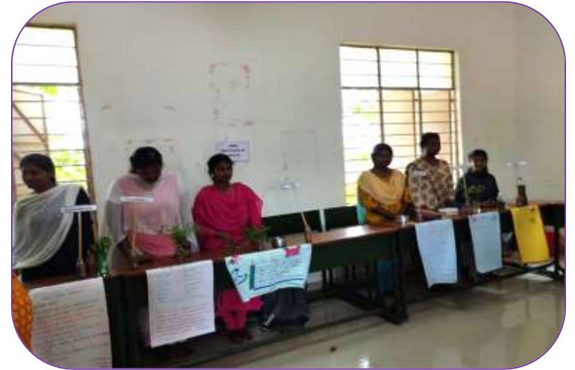
Dept of Botony