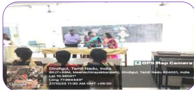
Dept of BBA