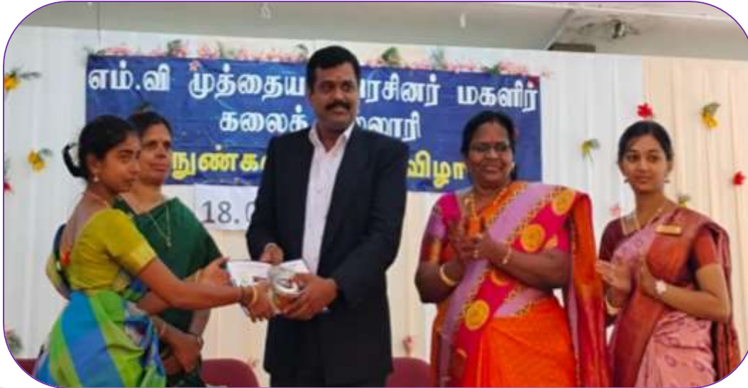
Fine Art's Chief Guest

18.03.2024 அன்று நமது கல்லூரியில் கவின் கலை விழா சிறப்பாக நடைபெற்றது.