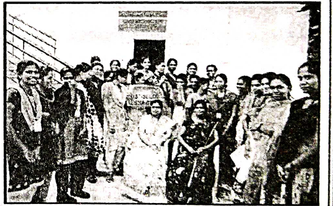
தாவர உயிர்த்தொழில் நுட்பவியல் துறை